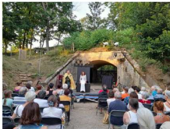
C(h)œurs de Reine(s) dans la cour du Fort du Paillet avec les comédiens de la compagnie TransaT.